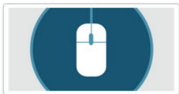
Trámites y Gestiones