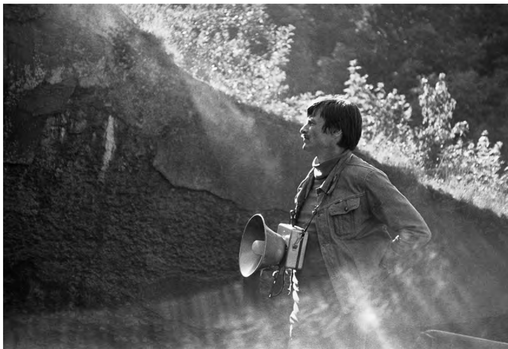
Andrei Tarkovsky. En el rodaje de Stalker , 1978.

Acceso: gratuito con reserva previa hasta completar aforo (40 personas) a través del e-mail info.coleccionmuseoruso@malaga.eu