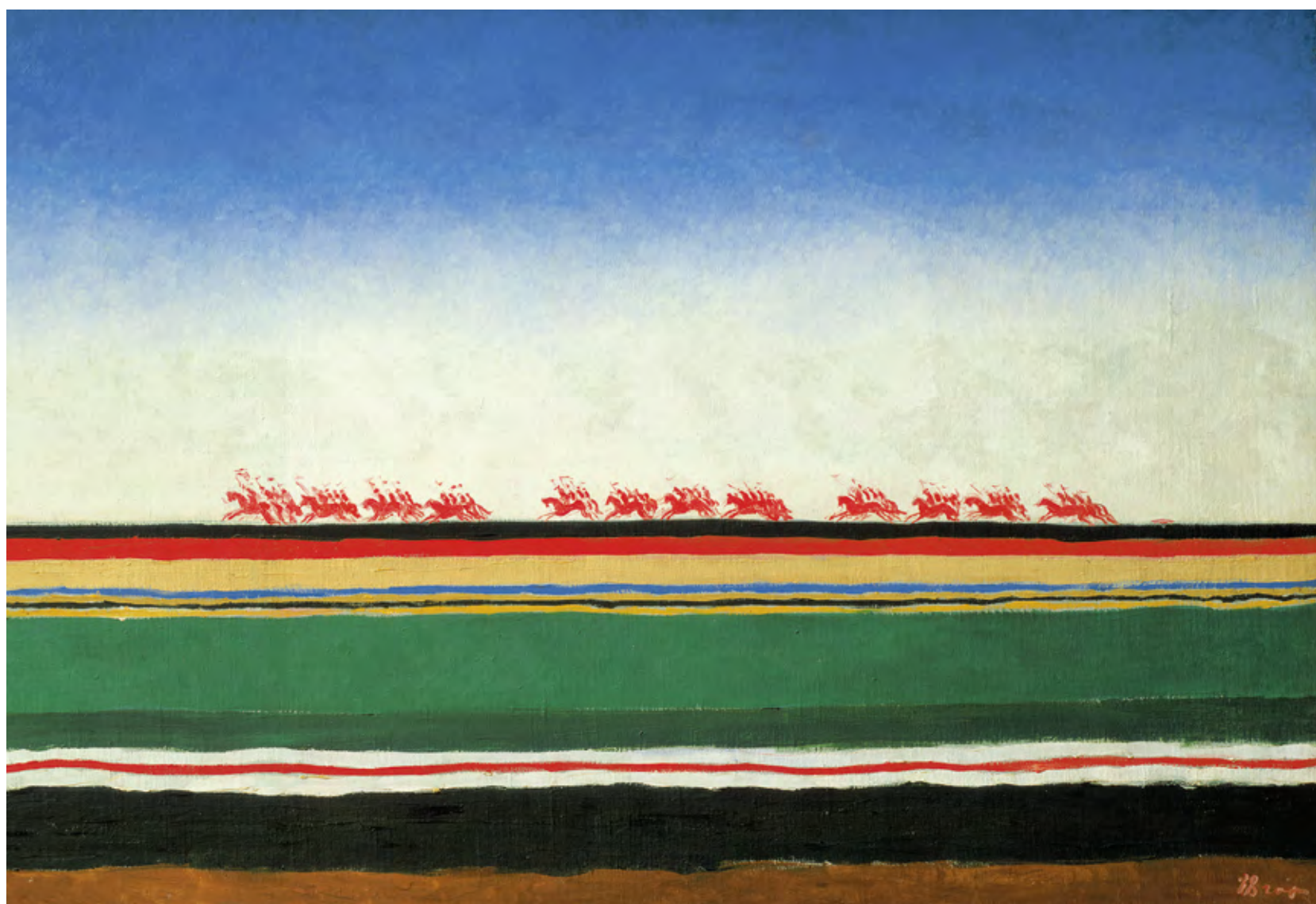
Kazimir Malévich. Caballería Roja c. 1932