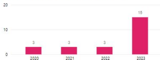
Número de Ayuntamientos conectados a alta velocidad