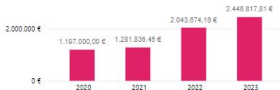
Presupuesto consignado para la modernización municipal