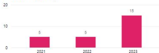
Número de Ayuntamientos con certificación del ENS (Esquema Nacional de Seguridad)